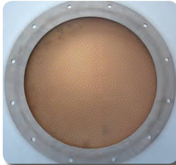
Ein gereinigter Filter – fast wie neu.