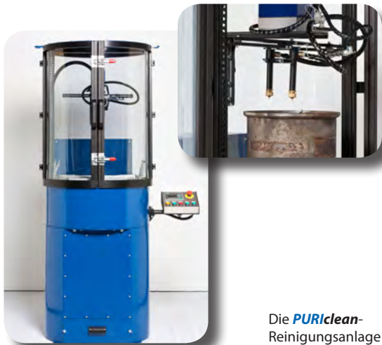
Die PURIClean -Reinigungsanlage

Ich möchte in der nächstgelegenen Werkstatt eine gründliche Filterreinigung durchführen lassen. Bitte geben Sie mir die notwendigen Kontaktinformationen.